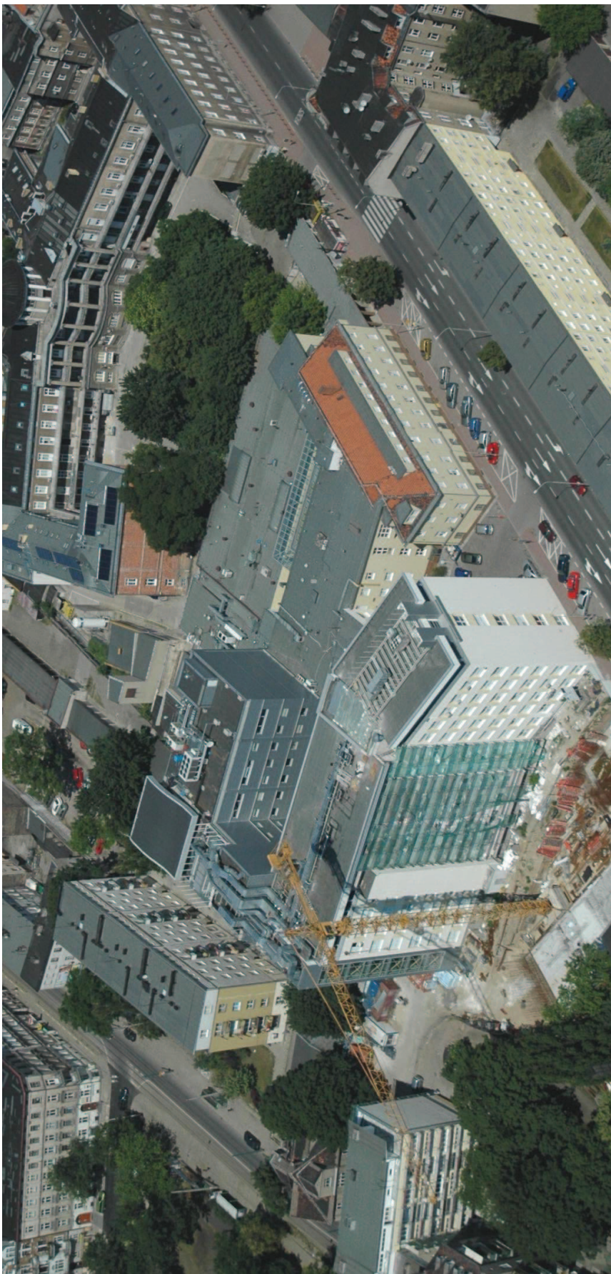
ARCHIWUM FOT. 12 Komplex budynków WCO i Szpital Przemienienia Pańskiego