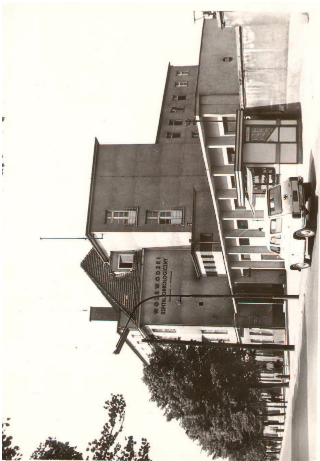
ARCHIWUM FOT . 8