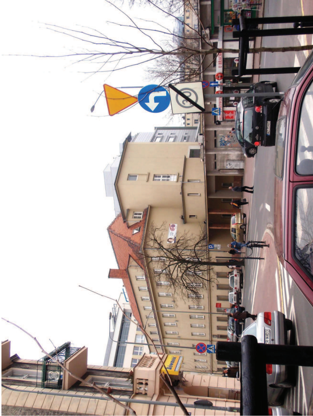
FOT. 3 Widok Starego Szpitala (1) i budynku gospodarczego (13) od strony dawnego wejścia głównego