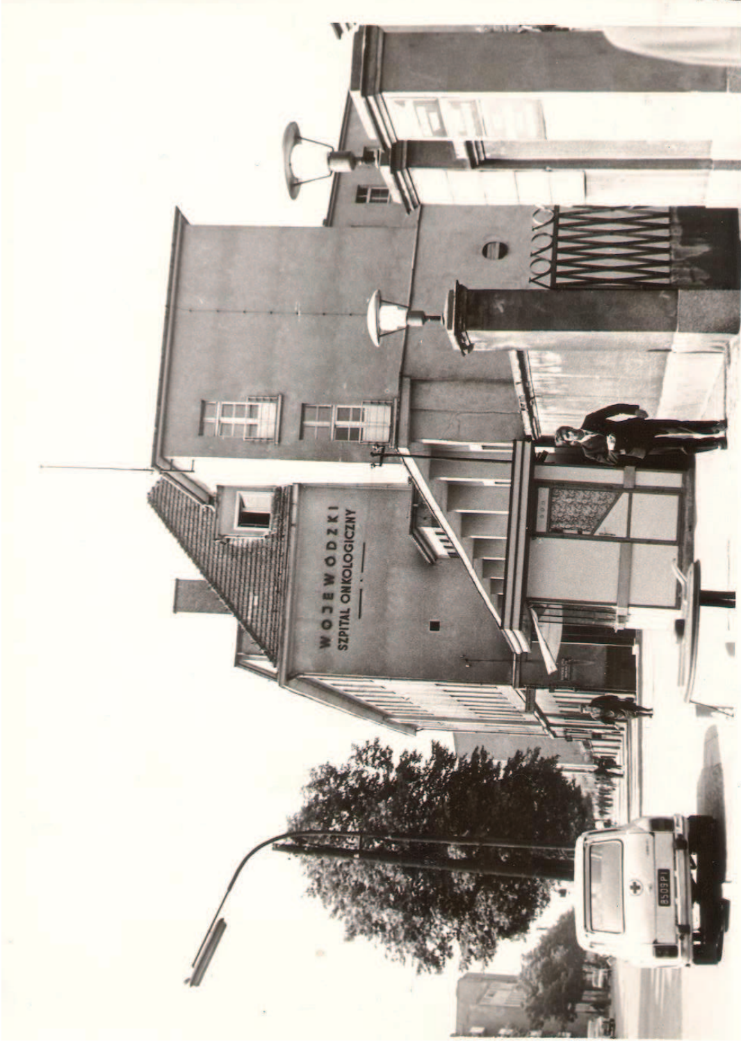
ARCHIWUM FOT. 7