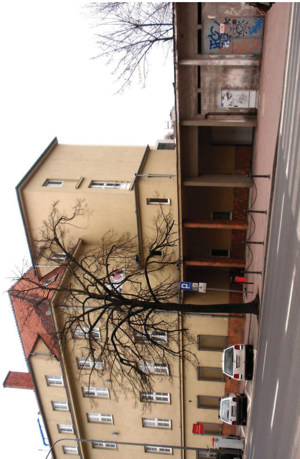
FOT. 4 Stary Szpital (1) klatka schodowa oraz budynek gospodarczy (13)