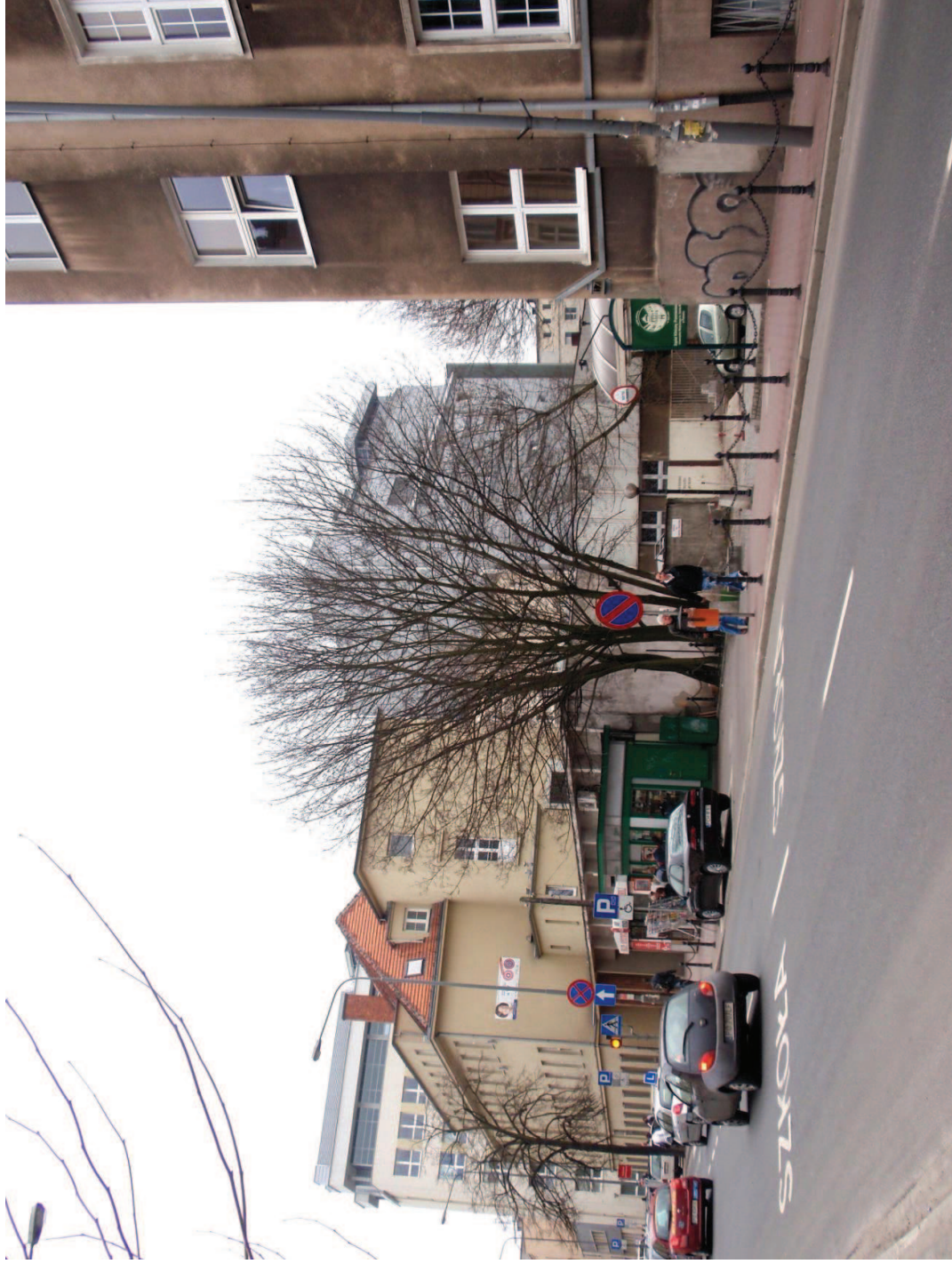
FOT. 4 Widok wylotu ul. Garbary od strony Szpitala Przemienienia Pańskiego