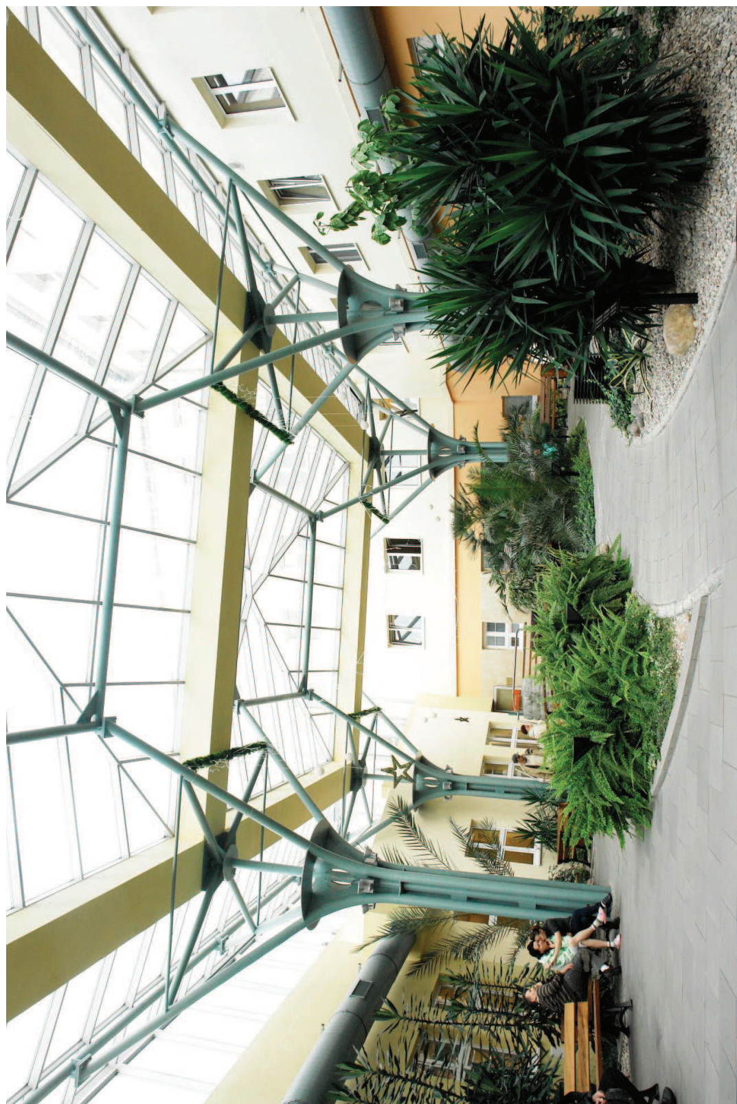
FOT.6 Ogród zimowy