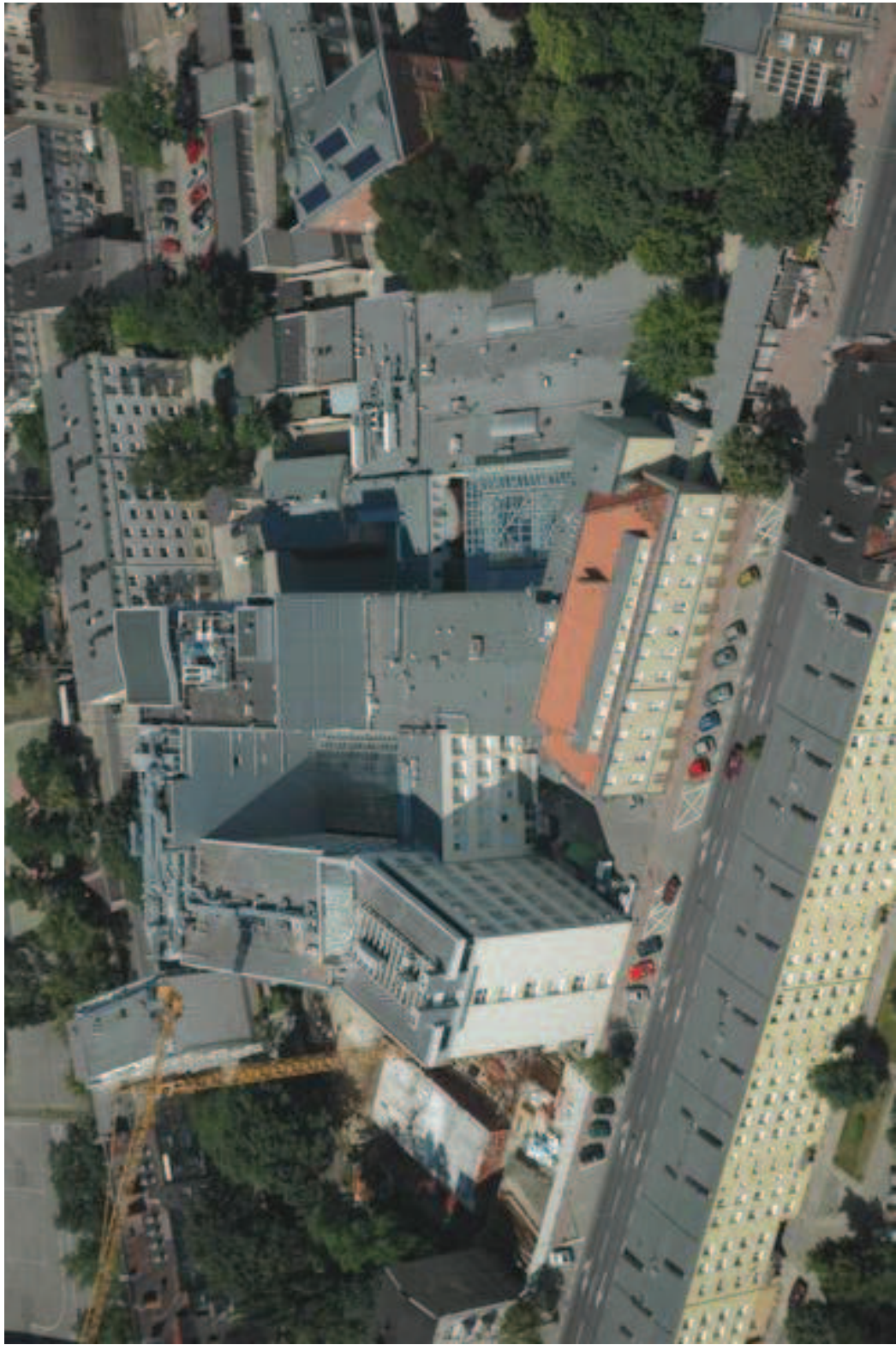
ARCHIWUM FOT. 10 Komplex budynków WCO