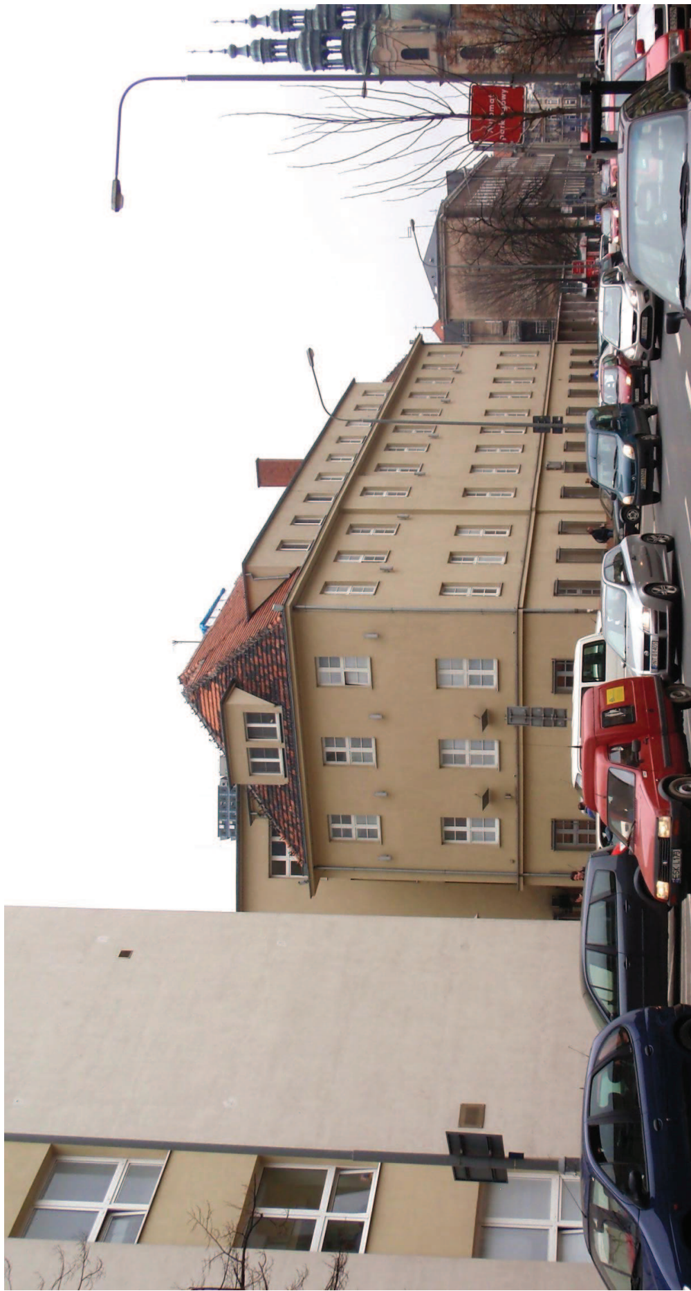
FOT. 3 Widok Starego Szpitala (1) w kierunku Szpitala Przemienienia Pańskiego