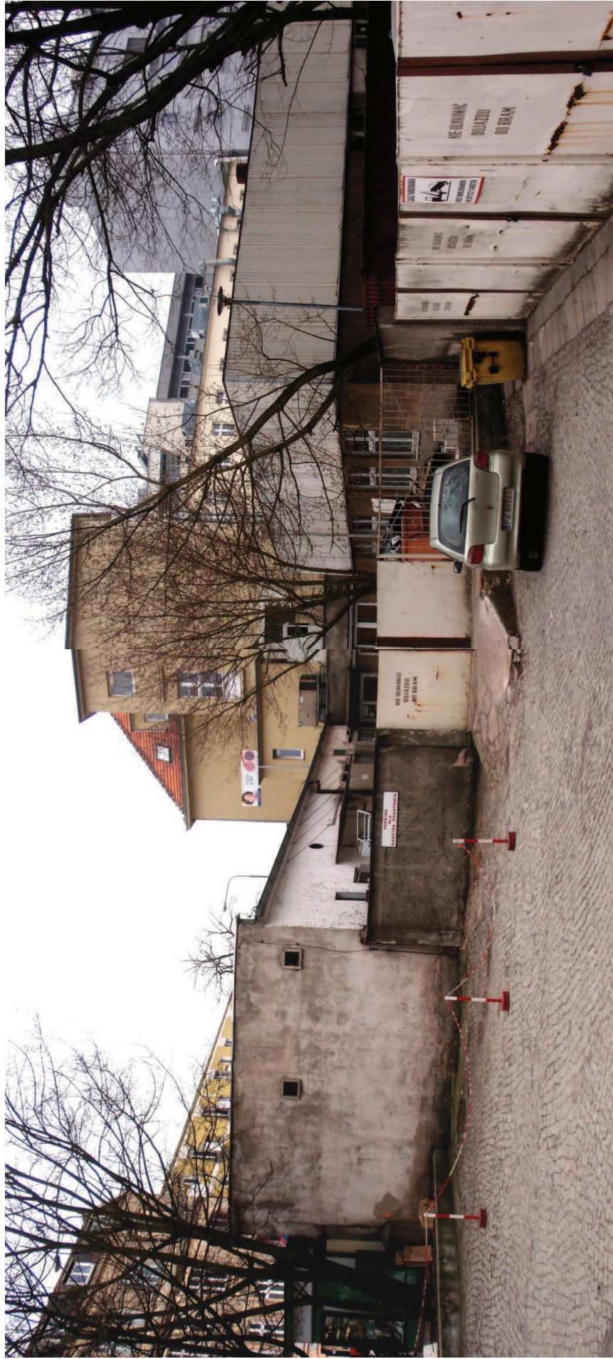
FOT. 5 Widok podwórza gospodarczego z wjazdem od strony Szpitala Przemienienia Pańskiego