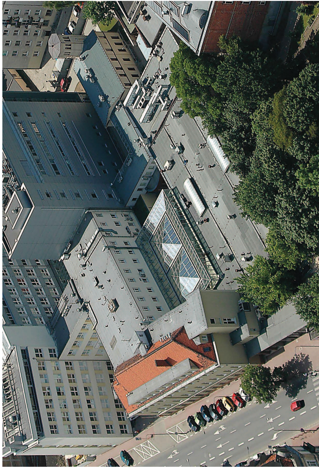
ARCHIWUM FOT. 11 Komplex budynków WCO